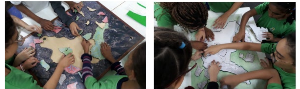
Sub-bacia do córrego do Acaba Mundo