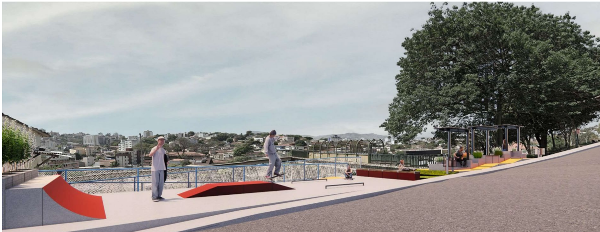
PROPOSTA DE TRATAMENTO DE FRONTEIRA E TALUDE COM ÁREAS PÚBLICAS