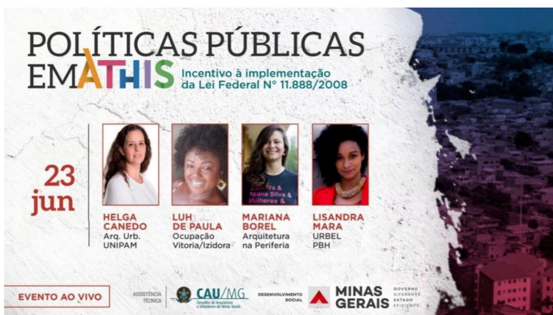
Figura 2 – Divulgação do evento online “Políticas Públicas em Athis, em junho de 2021. Elaboração Ascom-CAU/MG, jun. 2021.