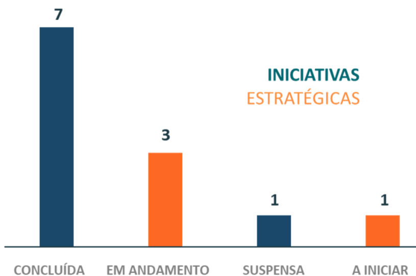
Gráfico 2 – Situação das iniciativas estratégicas com desenvolvimento previsto pela CATHIS, em 2021. Elaboração própria, jan. 2022.

Sobre as 12 (doze) iniciativas estratégicas estabelecidas pela CATHIS-CAU/MG para desenvolver no exercício de 2021, uma ação foi suspensa em virtude da pandemia de covid-19, qual seja, a que buscava articulação interinstitucional com a finalidade de implementação da ATHIS como política pública local nos municípios mineiros da Zona da Mata Norte. Quanto à iniciativa estratégica que pretendia relacionar ATHIS com o novo marco regulatório do saneamento, considerando o impacto nos territórios vulneráveis, não foi iniciada. Das demais iniciativas iniciadas, sete foram concluídas e outras três serão continuadas no exercício de 2022.